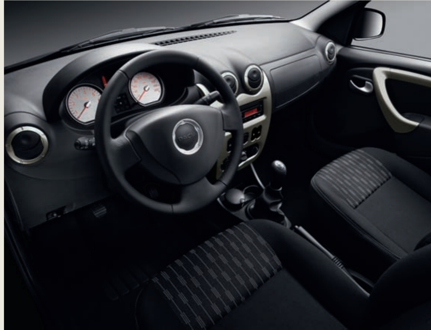
Interieur Logan MCV