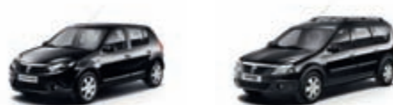
Zwarte koplampmaskers voor de Sandero.