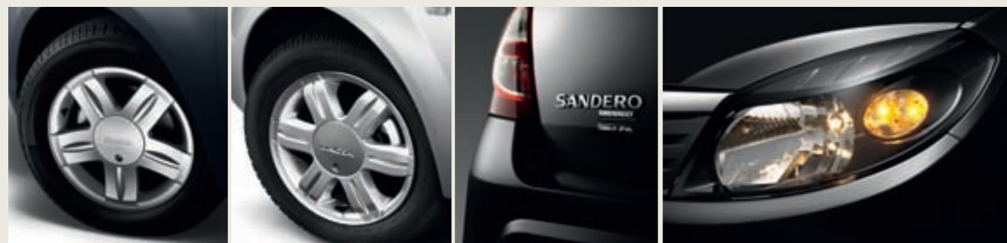
Lichtmetalen wielen 15" Sandero