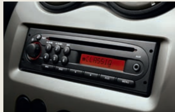
Radio CD/MP3 met jackplug aansluiting en bediening achter het stuurwiel optioneel in het Pack Exclusive.